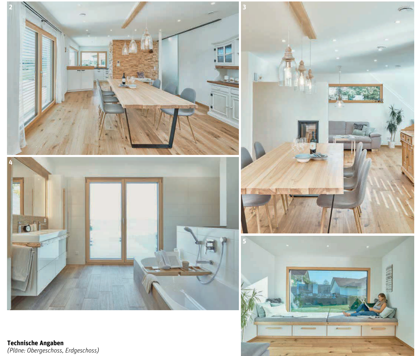
Technische Angaben (Pläne: Obergeschoss, Erdgeschoss)

Eine Herzensangelegenheit der Bauherren ist das Energiekonzept ihres Hauses. «Wir wollten ein Eigenheim, das möglichst energieautark ist», so das Ehepaar. Da bei Häusern ein Grossteil der Wärmeenergie über die Aussenwände verloren geht, ist eine hervorragende Dämmung, wie etwa bei der Gebäudehülle ÖvoNatur Therm von Weberhaus, eine Grundvoraussetzung für ein hohes Mass an Autarkie. Zudem sorgen dreifachverglaste Fenster, eine Wohnraumlüftung und die passende Heiztechnik für eine hohe Energieeffizienz. Dank Photovoltaik-Anlage und Batteriespeicher erfüllt das Eigenheim der Familie die hohen Anforderungen eines KfW-Effizienzhauses 40 Plus. Das Niedrigenergiehaus erhält somit die höchste deutsche Förderstufe für energieeffiziente Häuser. (pd/el)